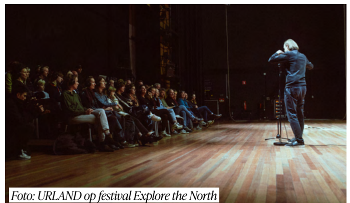
op festival Explore the North

Wij vertrouwen erop dat het maatschappelijk belang en de toegankelijkheid van onze organisatie en activiteiten hierboven voldoende is toegelicht. In het volgende hoofdstuk benaderen wij deze onderwerpen nog op het gebied van de organisatie.