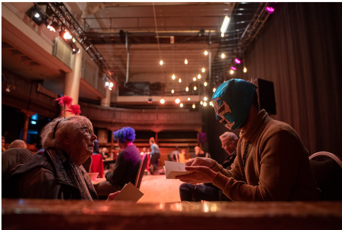
Schuilplaats Westerkerk met Dear Care van MOHA