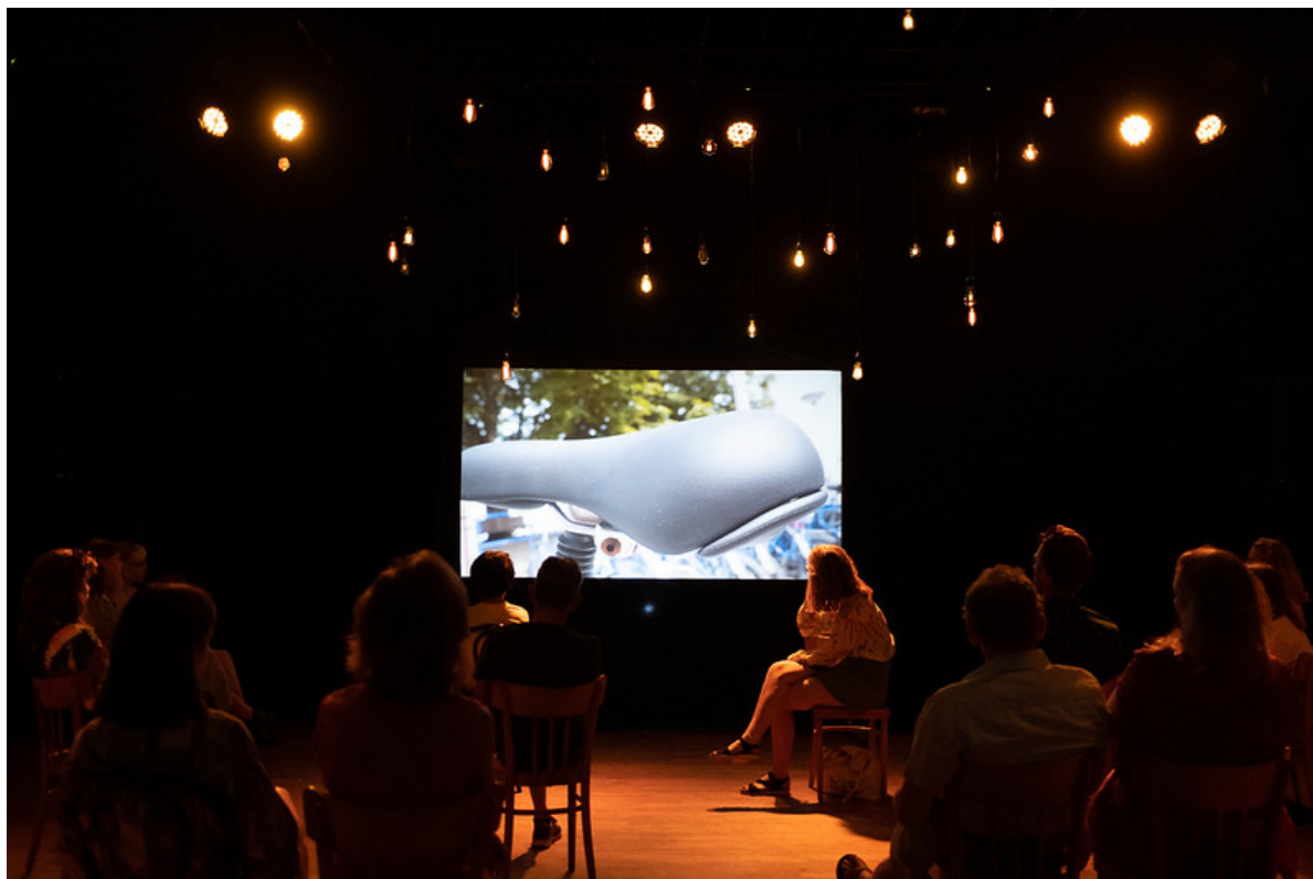
Presentatie Jonge Schrijvers – Het Grote Onbekende