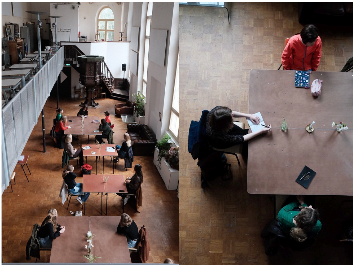
Startbijeenkomst Jonge Schrijvers 2020 in de Westerkerk

kunstenaars als op het vlak van talentontwikkeling. Zo meldden zich zo'n 25 deelnemers aan onze schrijfcursus Jonge Schrijvers die wij sinds 2017 in samenwerking met Meeuw Jonge Theatermakers organiseren. In december vonden daarnaast de audities plaats voor onze eerste Poetry Circle 058 die wij samen organiseren met Poetry Circle Nowhere (Amsterdam). Ook was 2020 voor Explore the North een voorbereidend jaar op onze toetreding tot het noordelijke netwerk voor talentontwikkeling Station Noord. Een netwerk dat vanaf 1 januari 2021 is toetreden tot de BIS.