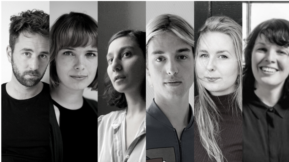
De deelnemers aan de Verwonderkamer