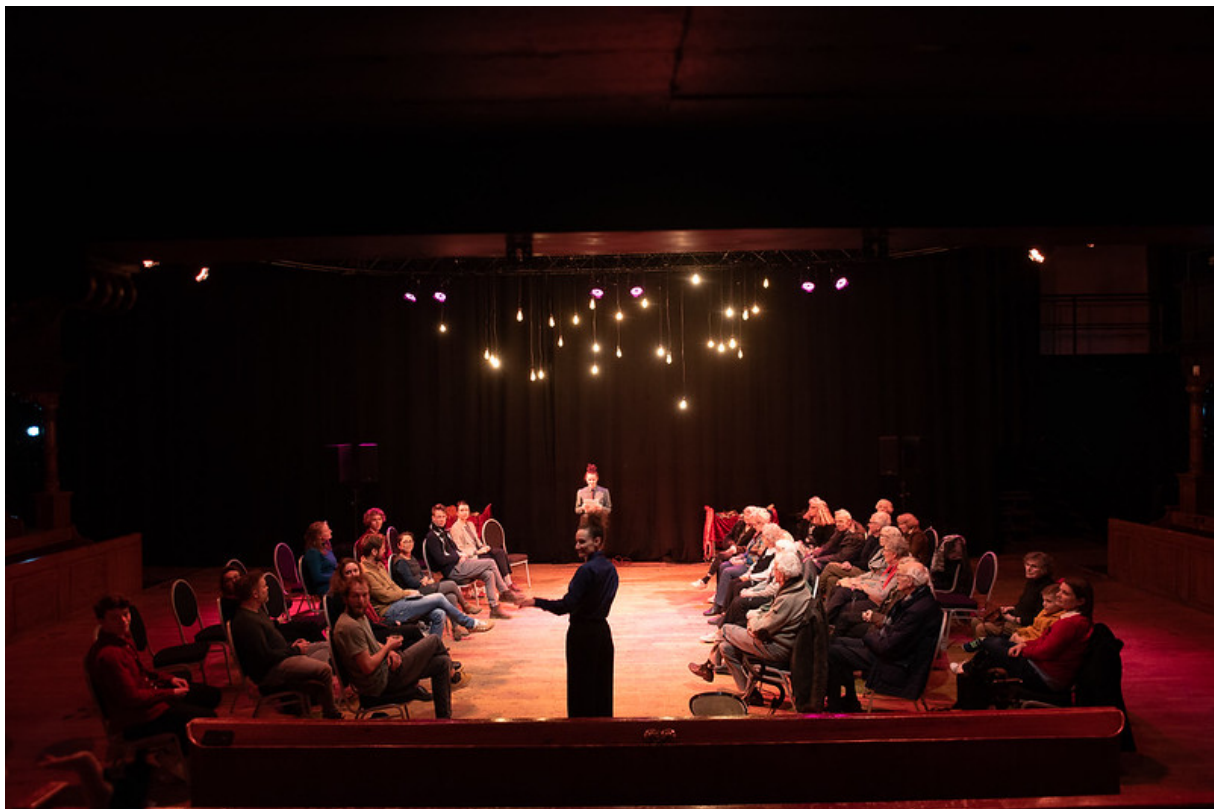
Dear Care van MOHA in de Westerkerk – met bewoners van verzorgingstehuis Nylânstate

“De commissie vindt dat het festival een heldere artistieke visie beschrijft. Ze vindt het positief dat het festival nadrukkelijk ruimte wil bieden aan interdisciplinaire projecten van jonge en talentvolle makers binnen de culturele infrastructuur van Friesland. Eveneens positief is de commissie over de vernieuwende en experimentele producties op het gebied van literatuur en podiumkunsten die het festival presenteert. De commissie vindt dat de ambities om dat vernieuwende aanbod ook in de komende jaren te tonen helder zijn beschreven. Het festival streeft volgens haar passend naar scherpe en actuele invalshoeken voor de programmering. Het hanteren van een overkoepelend thema, zoals “positief activisme”, met onder meer Pussy Riot in 2019 geeft volgens de commissie duidelijk inhoudelijke richting aan het programma. Zij vindt het aansprekend dat het festival met dergelijke kaders jonge makers stimuleert om zich in artistieke zin uit te laten over wat hen bezighoudt.” – beoordeling door festivalcommissie Fonds Podiumkunsten