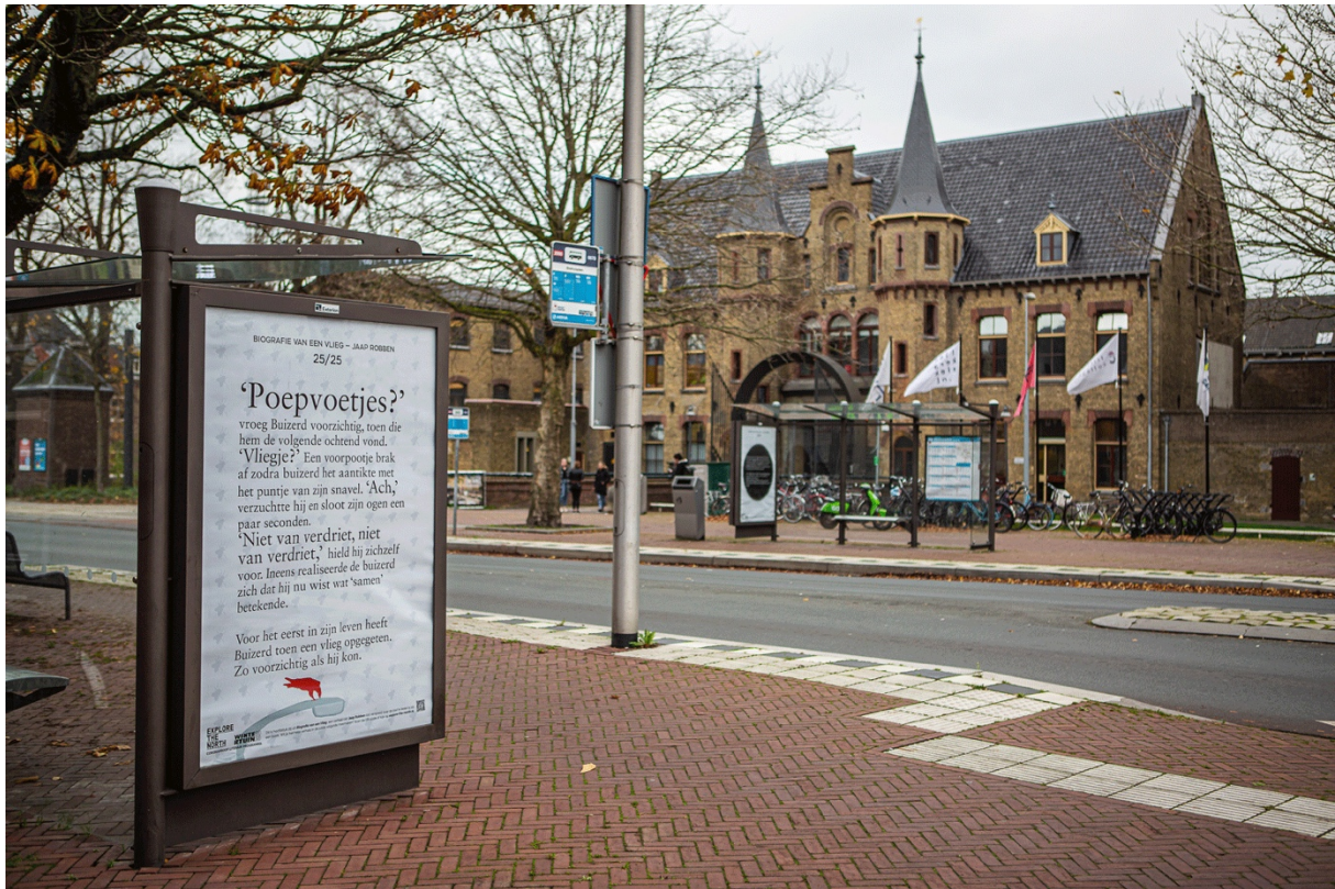
Biografie van een Vlieg in Leeuwarden