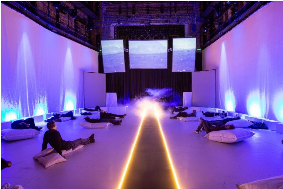
Work-in-progress Enter Salzirius van Gemale