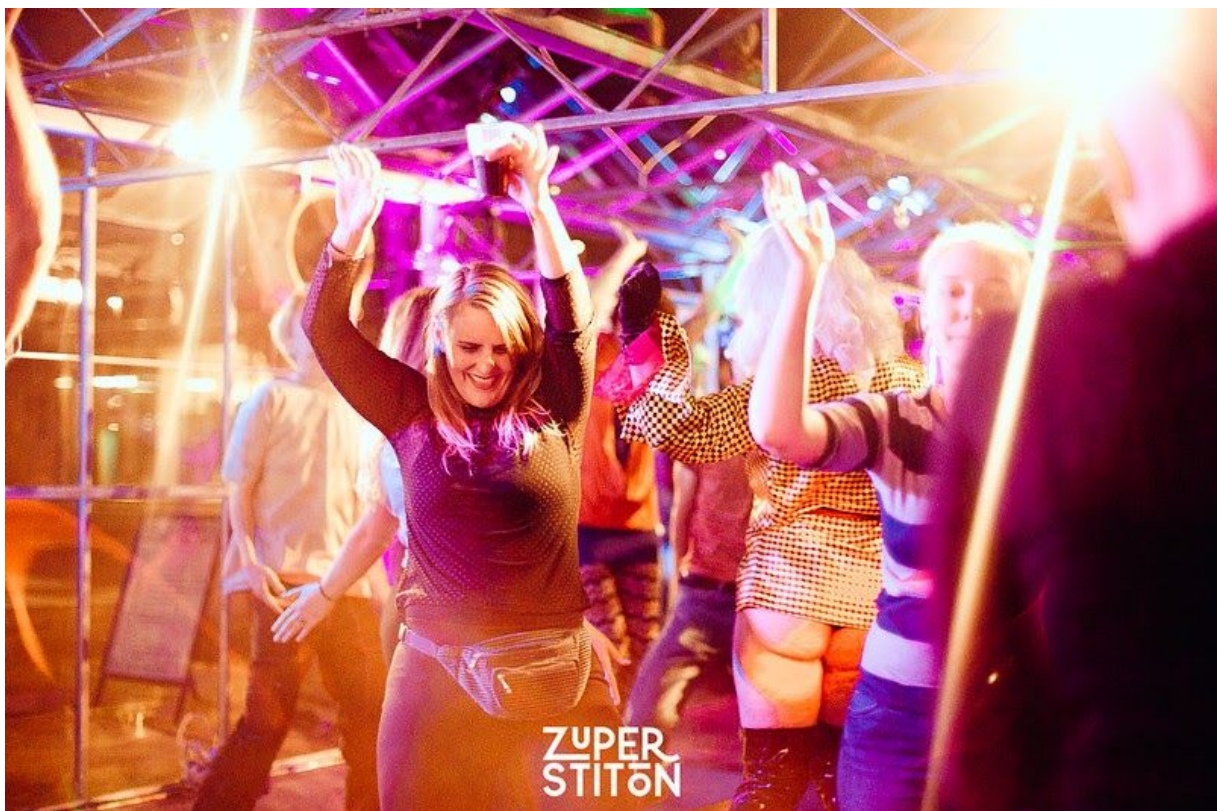
Zuperstition in de Stadskas - Explore the North 2019

Zo begonnen we het weekend - gecureerd door Podium Asteriks / de Stadsoase - met SKRRRT, een lokaal hiphopcollectief. Een groot feest met veel dansende jonge mensen. De dag erop sloten we de avond af met lokale dj's die vooral disco en wereldmuziek draaiden. Zondagmiddag kwamen meer dan 40 mensen ouderwets bordspelletjes als Risk en Kolonisten van Catan spelen en werd er zelfs een potje badminton in de kas uitgevochten. Op maandag 11 november, tijdens Sint Maarten deelden we snoepjes uit aan iedereen die een liedje kwam zingen op het podium van de kas. Een groep uit de Gemeente Waadhoeke kwam brainstormen over een groenere omgeving en een nieuw lokaal boekingskantoor (Veer Agency) organiseerde zijn eerste showcase met drie lokale bands. Honderd docenten bezochten op de donderdag het educatiefestival KEK en sommige hiervan bleven hangen voor de Hit the North showcase van die avond. Stilte en aandacht heersten tijdens de verhalenavond op een vrijdagavond (!) waar verschillende ervaren en onervaren verhalenvertellers hun verhaal deelden met meer dan 100 mensen die allemaal roerloos bleven zitten. Op de tweede zaterdag losten de linkse mannen het probleem op van jongeren die minder lezen. En die avond vond het allereerste dusdanig transparante /openlijke LGBTQ-feest van Leeuwarden in de kas plaats.