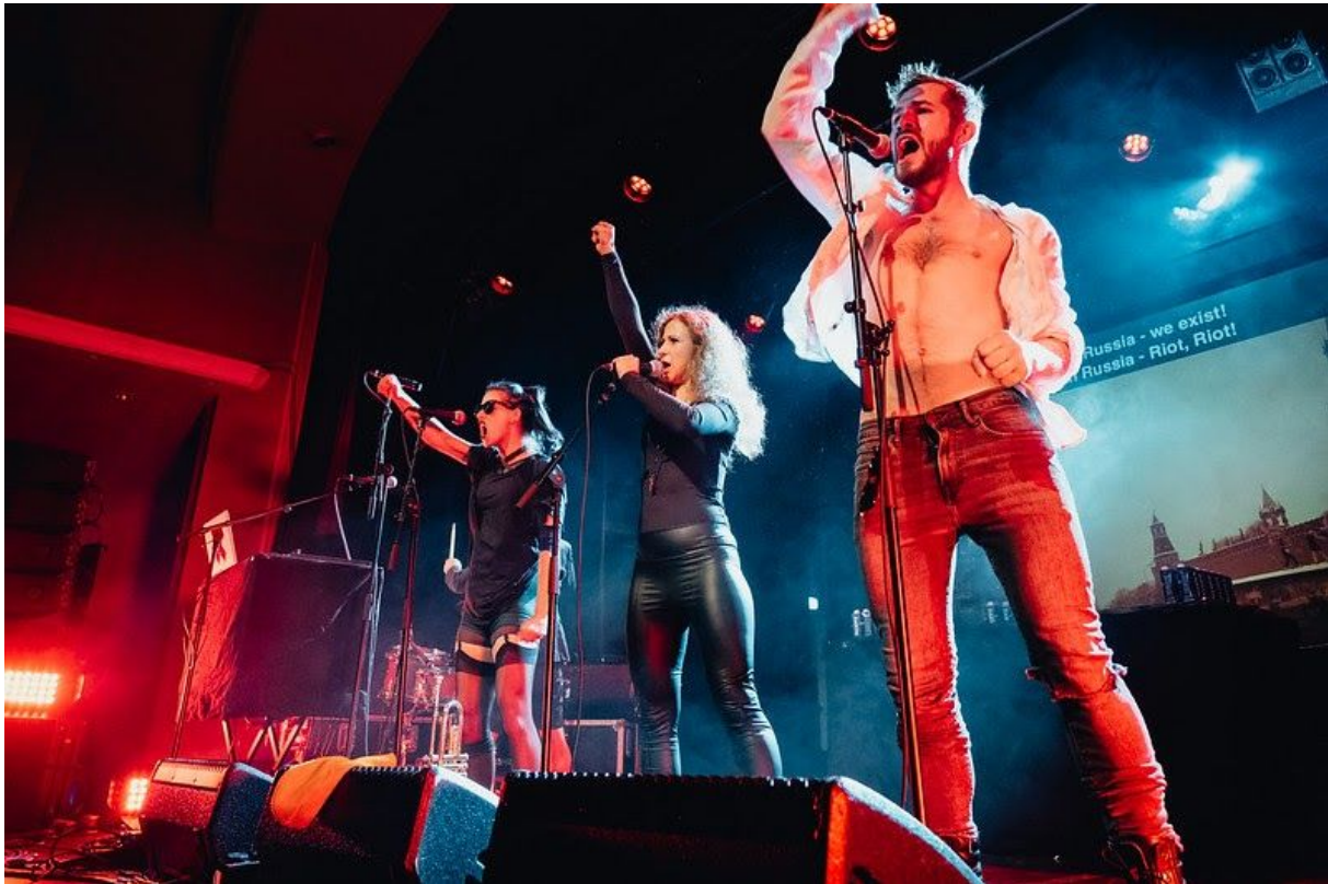
Pussy Riot - Explore the North 2019