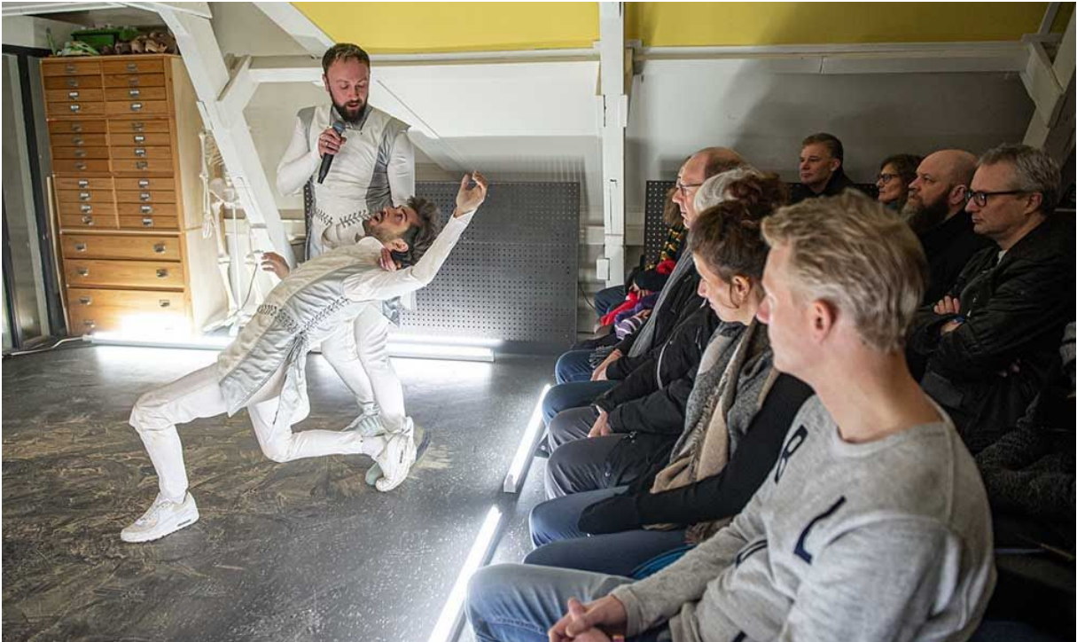
Teddy's Last Ride - Explore the North 2019

“En even later, in Zalen Schaaf, denderde Mdou Moctar uit Niger over het publiek met heftige gitaarpsychedelica uit de woestijn. Friesland de wereld in en de wereld naar Friesland, dat doet Explore The North goed.” - Leeuwarder Courant