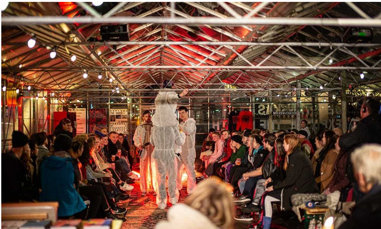
Self. Collective in de Stadskas - Explore the North 2019

Qua eigen inkomsten blijven de recettes wat achter op de verwachting, maar zijn hoger dan in 2018. We hebben dit jaar wederom geëxperimenteerd met verschillende ticketprijzen, zoals earliëst birds en een korting voor jongeren t/m 20 jaar. Zij konden voor minder dan de helft van de reguliere prijs naar het festival. Daarnaast hebben we voor de voorstellingen Aquasonic , En Toen Schiep God Mounir en de Immigrant achter losse tickets verkocht. Met deze wisselende prijzen en losse tickets blijven we experimenteren, maar we ontkomen niet aan het feit dat Explore the North een lastig festival blijft om te verkopen. Aan de andere kant zijn onze eigen inkomsten uit horeca verkoop naar verwachting en sinds de Stadskas een belangrijk onderdeel van onze dekking.