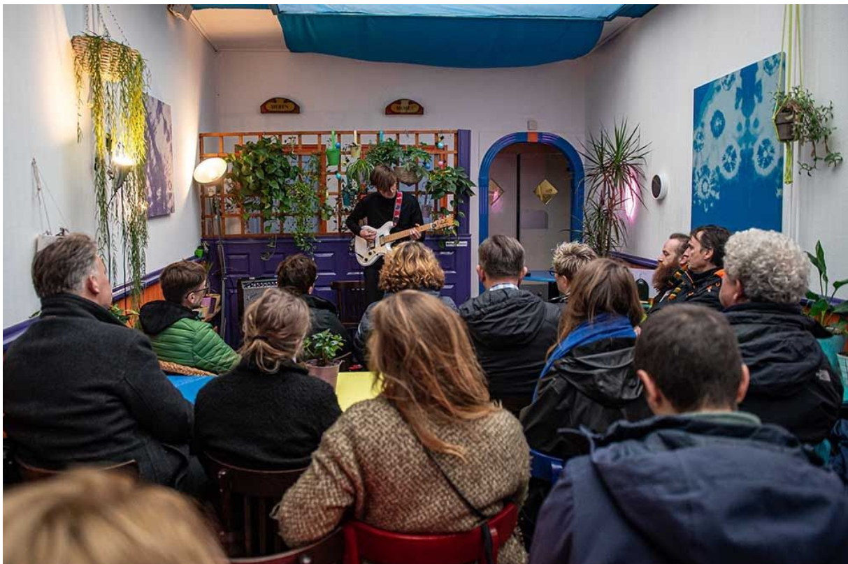
Explore the North 2019- Expeditie

De vorm waar wij vorig jaar een begin mee maakten, een intensief festivalweekend en een programma voorafgaand aan het festival (de Stadskas en losse voorstellingen) is er één die we dit jaar echt doorontwikkeld hebben en voor ons gevoel goed bij ons past. De Stadskas vond in 2019 plaats van 8 november tot en met 24 november, bijna een week langer dan vorig jaar. De kas was iedere dag geopend vanaf 12.00 uur met elke dag lunch, diner en afwisselend programma. Van een verhalenavond tot het eerste echte transparante LGBTQ-feest van Leeuwarden, alles kon en mocht in de Stadskas. De voorstelling Aquasonic , die we in 2018 geprogrammeerd hadden maar geannuleerd werd vanwege gezondheidsredenen ging dit jaar wel door. Een mooie samenwerking met Schouwburg de Harmonie, met wie we ook de voorstelling En Toen Schiep God Mounir presenteerden voorafgaand aan het festival. Samen met het Noordelijk Film Festival presenteerden we de premiere van de Immigrant van het Fries Project Orkest en organiseerden we samen met de Westerkerk hun openingsavond. Als afsluiting - de kers op de taart - het festivalweekend van 22 tot en met 24 november.