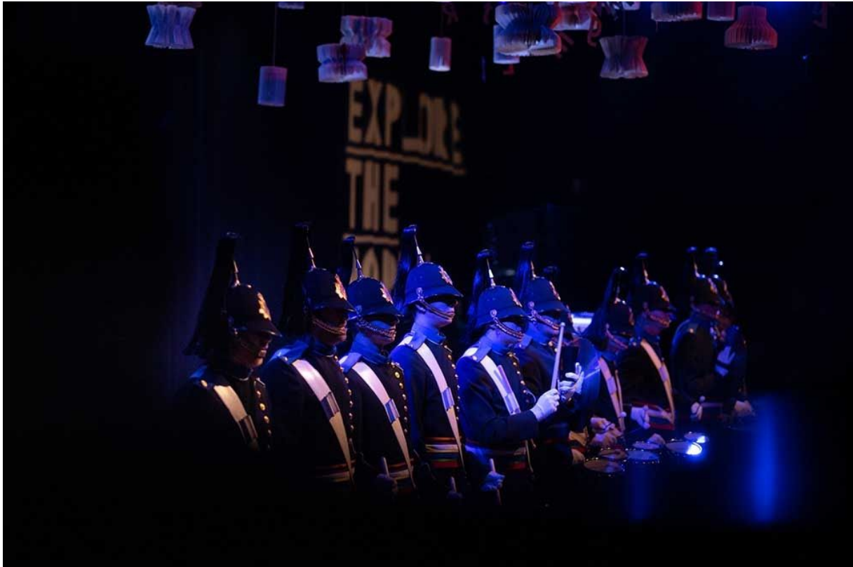
Het Pasveerkorps - Explore the North 2019