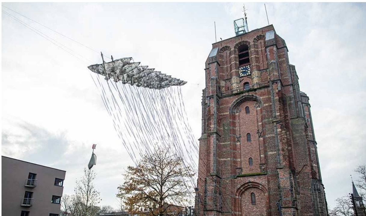
Silent Messengers - Explore the North 2019