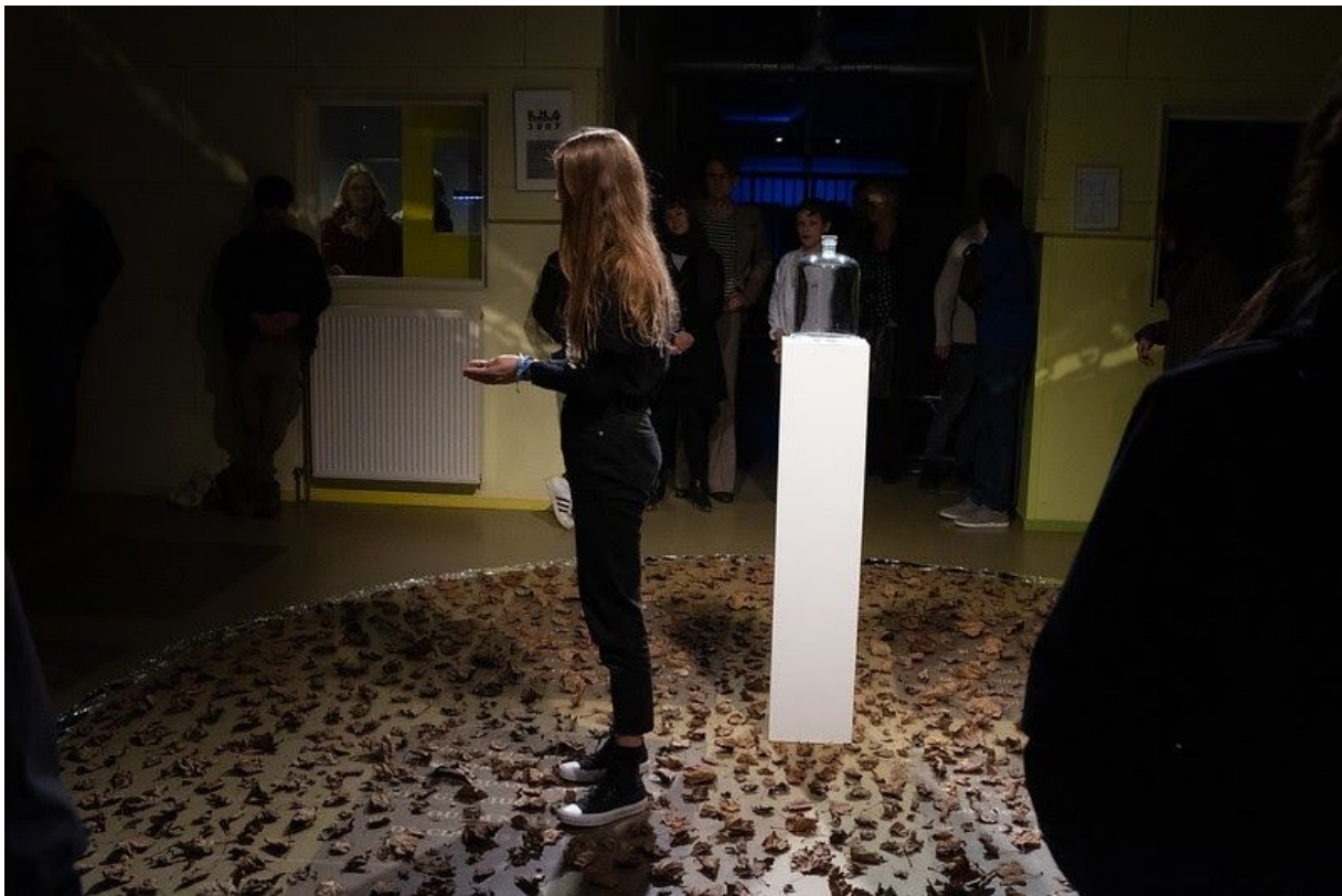
Nieuwe Werelden - Explore the North 2019

“Tijdens Explore the North in 2019 treed je het Grote Onbekende – de toekomst, de ander – tegemoet met hoop en positiviteit. Je wordt meegenomen door artiesten die de barricaden niet schuwen en hun plek op deze wereld durven in te nemen. Ze hebben idealen die ze durven nastreven. Ze fantaseren over nieuwe werelden. Eentje die wat vriendelijker is misschien, of mooier, of gezonder. Of gewoon anders – use your illusion! Ze zien hoe dan ook een toekomst waar zij (en jij!) invloed op hebben.”- zo omschreven we ons thema van afgelopen jaar. Dit hebben we heel sterk doorgevoerd in het programma waarmee de link tussen programma en thema misschien nooit eerder zo duidelijk naar voren kwam.