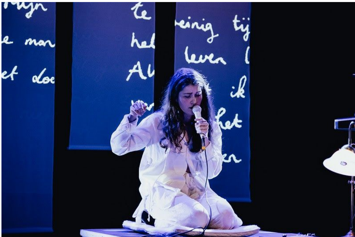
Pitou - Explore the North 2019