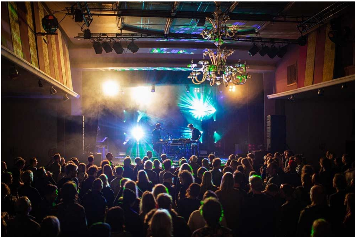
Weval - Explore the North 2019

een flinke verbetering in geslagen en zien we dan ook niet meer terug in dit onderzoek. Dit jaar benoemen de bezoekers een aantal keer de krapte in het blokkenschema, mensen hadden het gevoel dat ze moesten rennen om op tijd bij een volgende voorstelling te zijn. Daarnaast is de duurzaamheid van de Stadskas, met name het gebruik van plastic een aantal keer aangehaald. Ook wordt het gemis aan Friese dichters of de Friese taal een aantal keer genoemd. Punten voor ons om aandacht aan te besteden in het komende jaar.