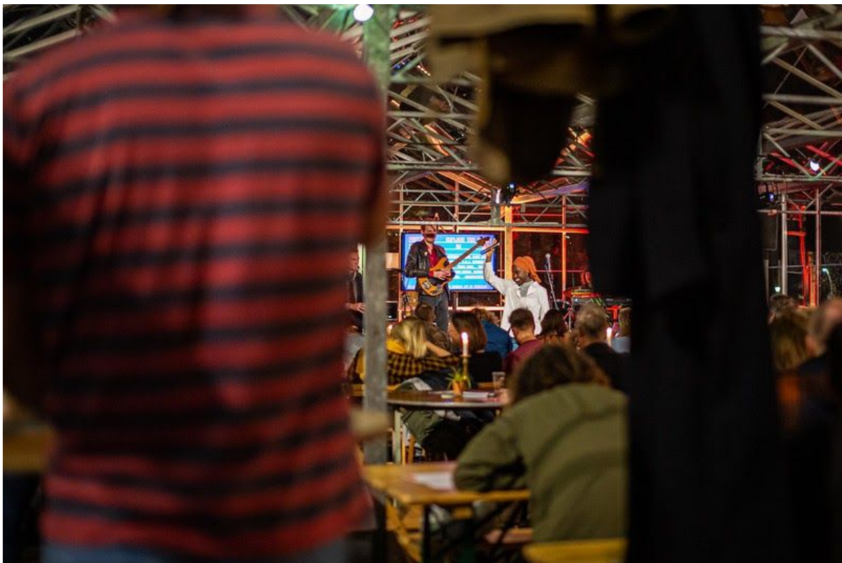
De Stadskas - Explore the North 2019

Een festivalhart, warm en gezellig, toegankelijk en zichtbaar, dat was de Stadskas in 2018 al. Iedereen vond het, dit moest blijven! Twaalf dagen vonden we niet voldoende, dus dit jaar mochten we onze glazen groentekas - in goed overleg met de Gemeente - maar liefst 17 dagen openstellen. Bijna heel november (voor ons gevoel) stond hij er, met iedere dag ander programma en andere partners. Een fijne transparante, maar zichtbare uitvalsbasis voor de gehele periode. Een plek waar mensen van alle leeftijden en achtergronden bij elkaar komen; toeristen, Leeuwarders, festivalbezoekers, artiesten, vrijwilligers en crew. Duizenden mensen bezochten dit jaar wederom de kas. Nieuwe mensen, maar ook veel terugkerende bezoekers. Zij kwamen eten, drinken, informatie halen, tickets kopen, programma bekijken of gewoon even chillen. We hebben dit jaar nog meer, nog uitdagender programma gemaakt. Van karaoke-avond tot silent disco tot educatie congres tot LGBTQ feest, zo breed en veelkleurig als de maatschappij zelf is. Wat ons betreft is het tweede jaar van dit 'experiment' geslaagd en zien wij de Stadskas ook graag volgend jaar weer terug op het Oldehoofsterkerkhof. De basis staat, nu is het aan ons om verbeterlagen te maken op het gebied van duurzaamheid, horeca, conversie en publieksontwikkeling.