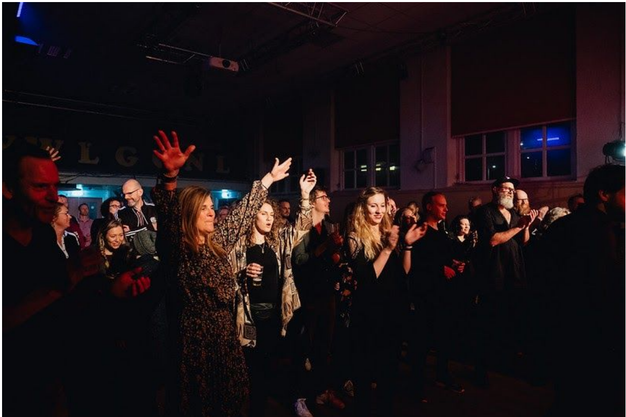
Explore the North 2019

Bekijk hier online het programmaboekje van Explore the North 2019.