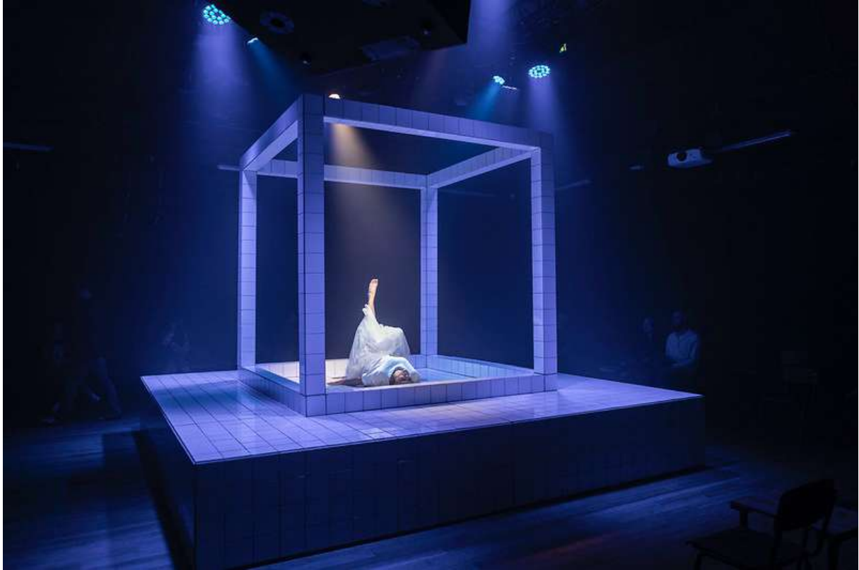
HOMSK - Kamaloka

In samenwerking met Tresoar, Boekhandel Van der Velde, de Europese Literatuurprijs en het Nederlands Letterenfonds.