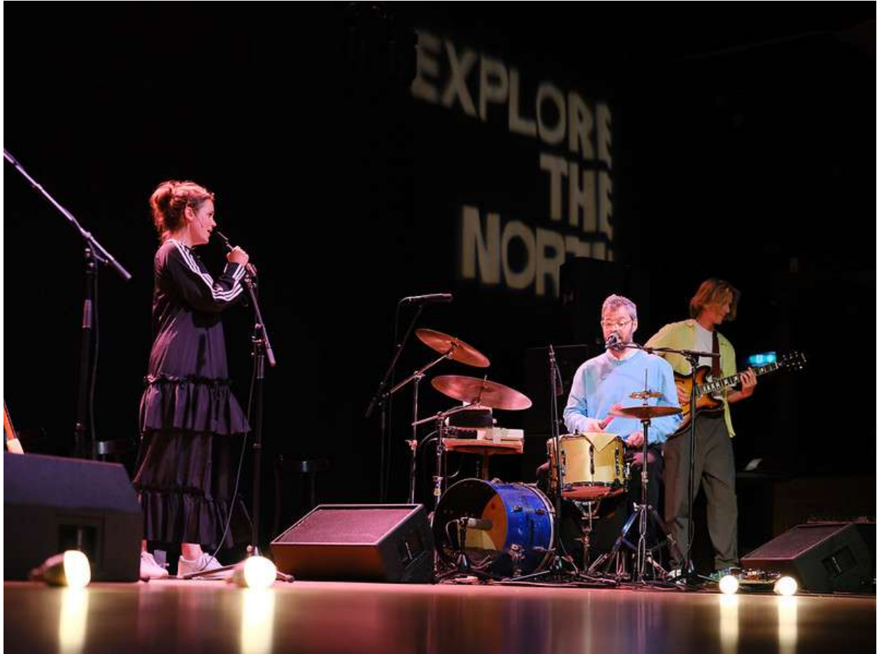
Club Nel – Het Spektakel