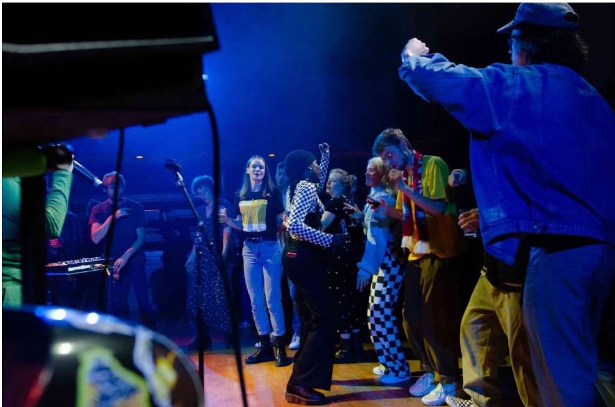
SELF. Collective in de Westerkas

Leeuwarden UNESCO City of Literature droeg financieel bij aan Pidgin X. Net als Noorderzon en Wintertuin al waren dit directe uitgaven die niet in onze jaarrekening zijn opgenomen. Al eerder (in 2020) kreeg dit project een bijdrage vanuit de proeftuin meertaligheid van We the North (met steun van het ministerie van OCW).