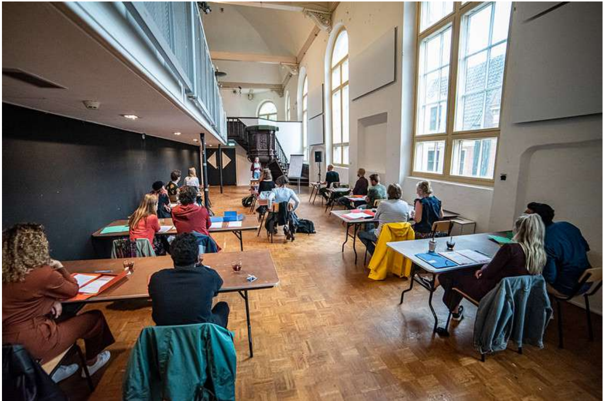
Pidgin Leeuwarden (de cursus Pidgin)

oude vorm al behoorlijk was opgerekt) en zo nu ook in een echt jaarrond programma met een focus op de Westerkerk. Dat zijn ondanks de moeilijke omstandigheden toch erg belangrijke leerpunten voor ons. The Summer Sessions hebben ons enorm veel kennis gebracht.