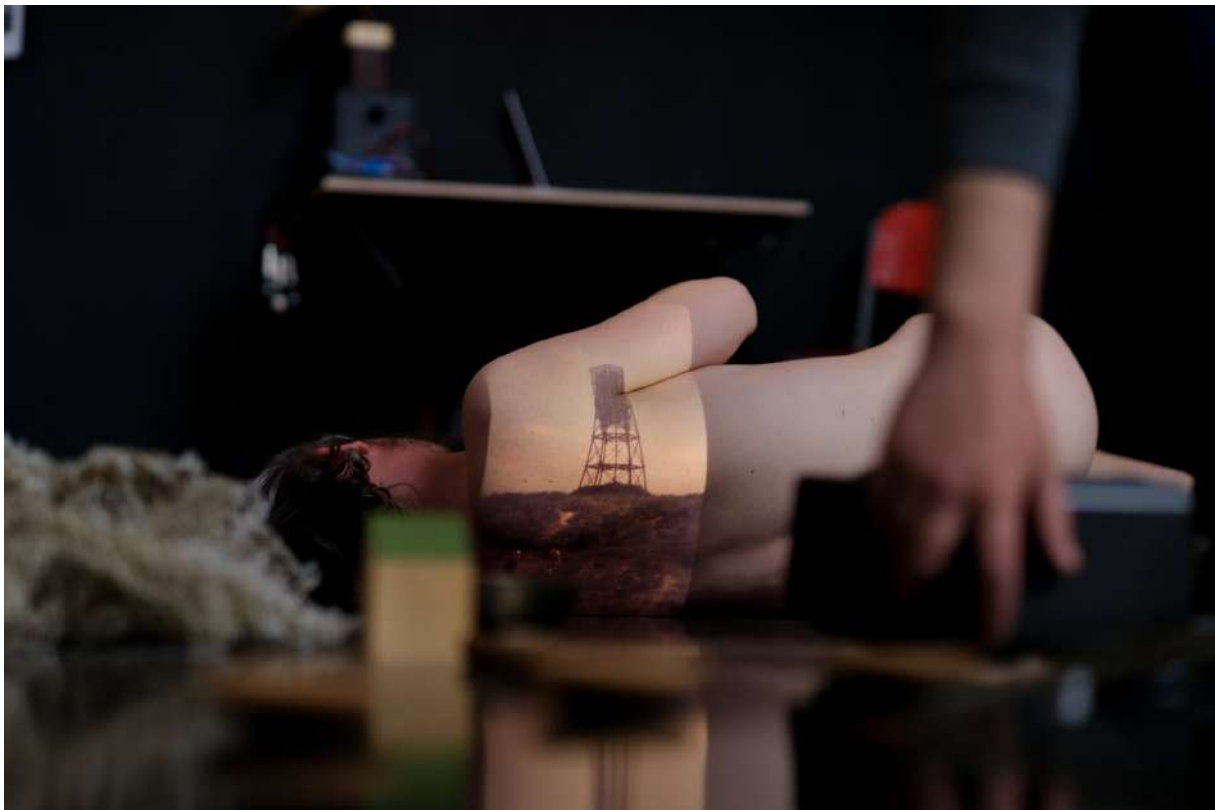
Tussenland – KAAP (residentie Westerkerk)