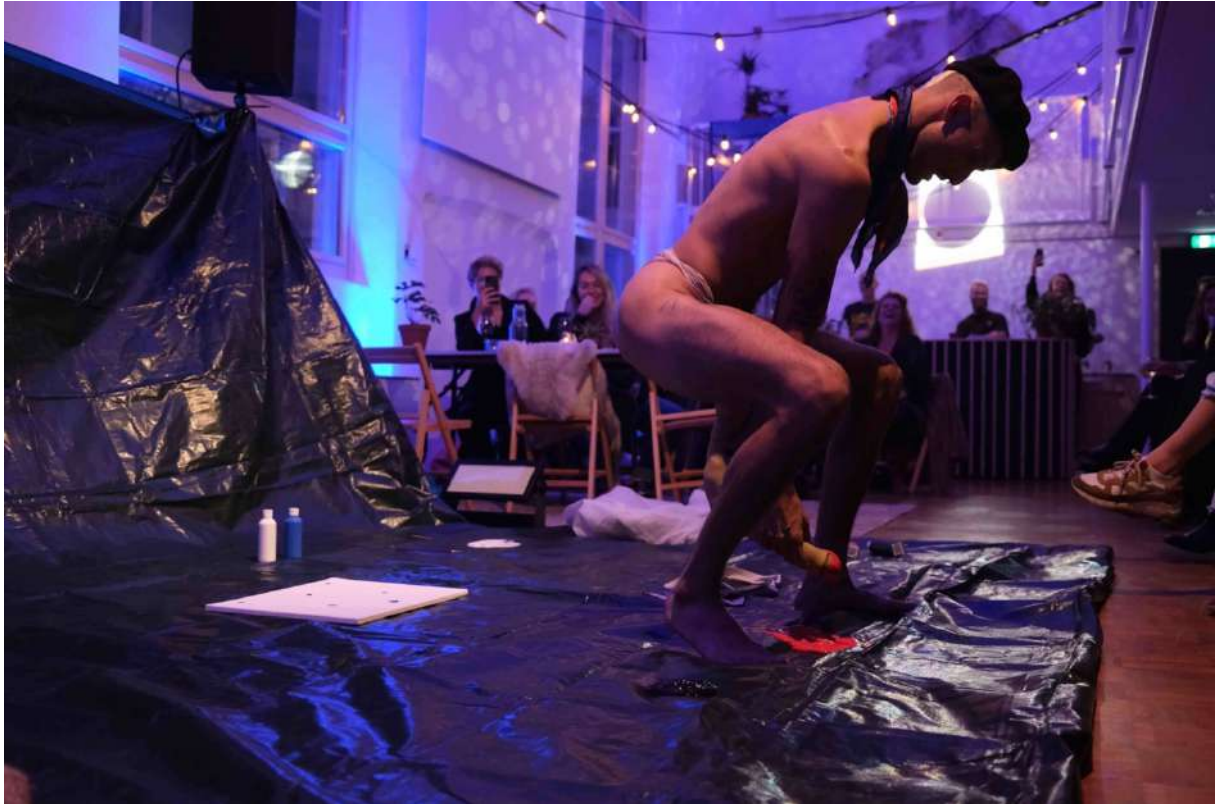
Zuperstition in de Westerkas

De focus ligt vanaf 2022 weer meer bij het ontwikkelen van een divers publiek, nu er weer gepresenteerd kan worden: binnen Leeuwarden en ook ver daarbuiten.