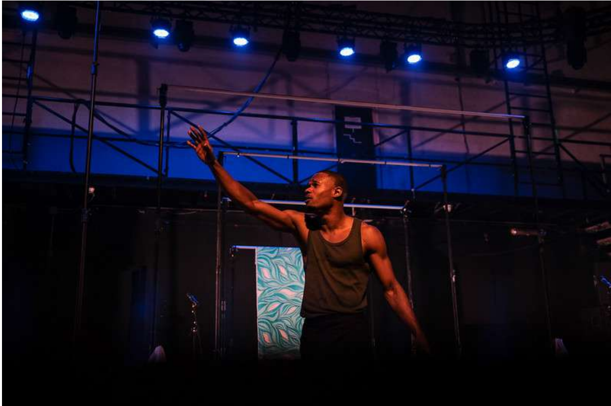
The Deconstruction of Aristote Bofunda Gemale